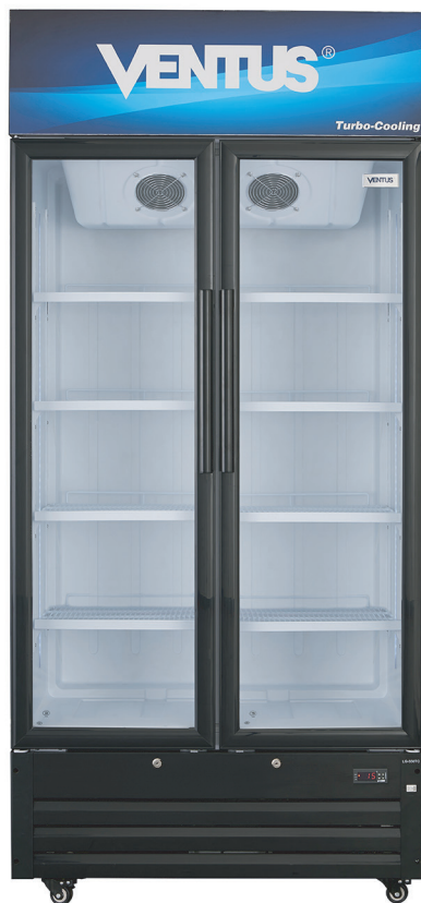
* Fotografía de referencia.