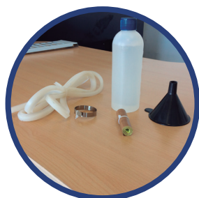
*Kit de repuestos.