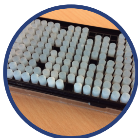
Marcador de fechas para productos.