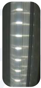
*Luz LED Interior