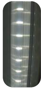
*Luz LED Interior